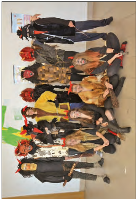
Čerti ve škole