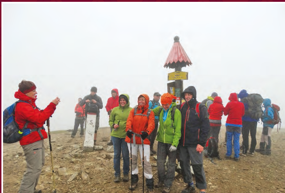
Kondor - V mlze na vrcholu - Rakoň (1876 m)