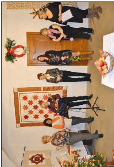
Vernisáž výstavy Kouzelný patchwork