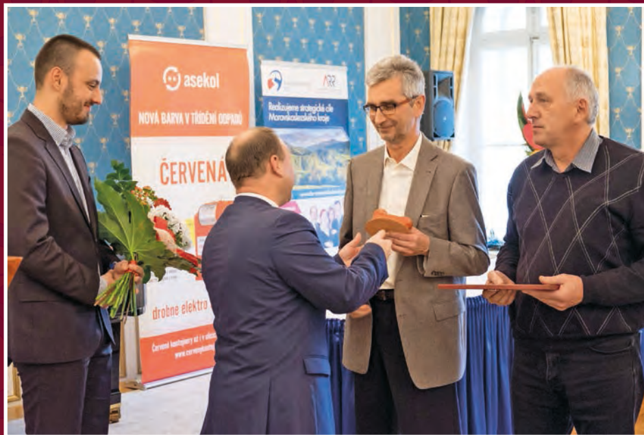
Převzetí Keramického sluchátka 2015 a finanční prémie