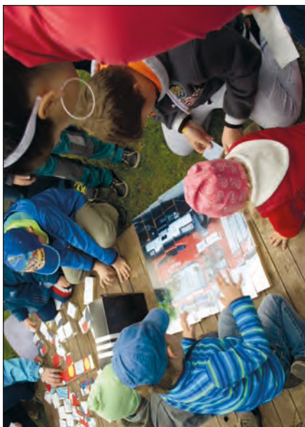
Soutěž pro děti