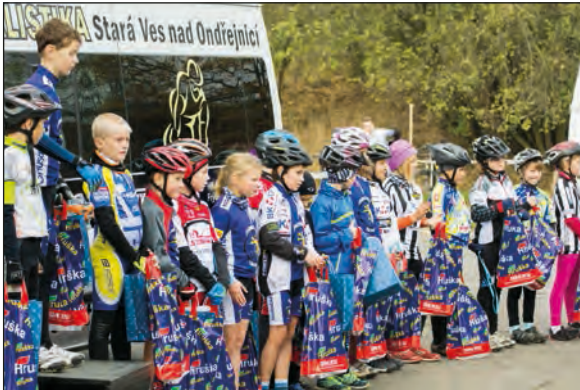
Vyhlášení náborového závodu dětí

S příchodem prosince pomalu končí také cyklokrosová sezóna finišující Mistrovstvím České republiky. Naši závodníci v cyklokrosu předvádějí stabilní výsledky, které jsou potěšující a dávají také příslib do budoucna. Oproti silniční sezóně se počet závodníků, pravidelně se zúčastňujících soutěží, snížil na přibližně šest.