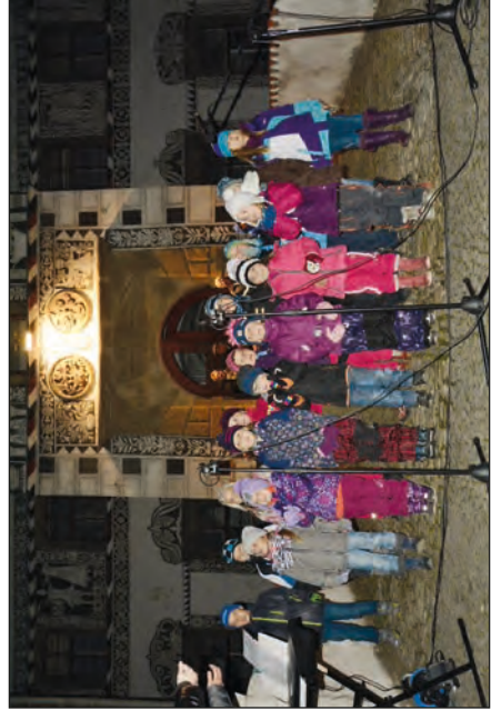
Představení k rozsvěcení vánočního stromu