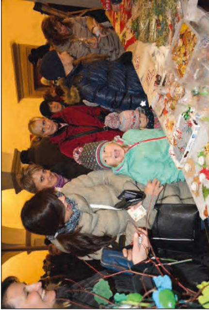
Výrobky na vánočním jarmarku