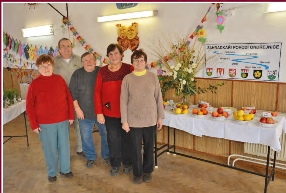
Členové výboru zahrádkářů na výstavě ovoce