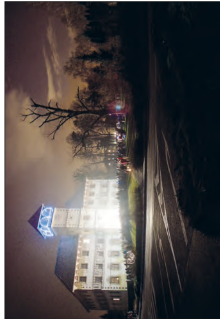
Rozsvěcení vánočního stromu