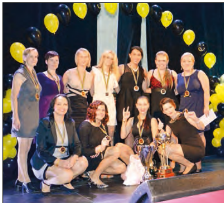
Vítězky Moravskoslezské ligy v požárním útoku 2015

čtvrtá místa. Právě vyrovnanost výkonů vynesla Starou Ves v polovině sezóny do průběžného vedení. Když pak s narůstajícím tlakem soupeřek přišlo přece jen několik zaváhání za sebou, zatímco na naší domácí soutěži triumfoval špičkový slovenský ženský tým – Turčianské Teplice, musely staroveské matadorky prokázat také notnou dávku psychické odolnosti. Na následujících soutěžích se tyto dva ženské týmy střídaly pravidelně na špiči průběžného pořadí a již několik kol před koncem tak bylo jasné, mezi kým se rozhodne o titulu. Na předposlední soutěži v Mošnově pak právě Stará Ves n. O. a Turčianské Teplice svedly fantastický česko-slovenský souboj, který byl jednoznačným vrcholem letošní hasičské sezóny. Ve dvoukolové soutěži předvedly oba týmy špičkové pokusy na úrovni absolutního ligového rekordu. O několik setin úspěšnější byly v tomto souboji titánů staroveské borky, čímž se vrátily do průběžného vedení a zejména si vytvořily rozhodující pětibodový náskok, který nakonec rozhodl o jejich celkovém vítězství, když na psychicky i takticky náročné závěrečné soutěži v Bartovicích se již ani jedna z rivalek nevyvarovala chyby. O celkovém triumfu staroveských žen tak nakonec rozhodl rozdíl pouhých dvou bodů.