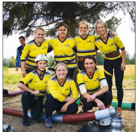
Vítězný tým staroveských hasiček (závěrečné kolo Moravskoslezské ligy, září 2015)

Již na začátku tohoto seriálu hasičských soutěží bylo jasné, že k celkovému vítězství bude potřeba prokázat nejen rychlost a bleskové sestřiky terčů, ale i psychickou odolnost, vytrvalost, stabilitu formy a taktickou vyspělost. Staroveský tým žen v tomto ročníku prokázal všechny tyto atributy, a proto svůj vítězný sen přetavil opět ve skutečnost. Zkušenost a vytrvalost musely holky prokázat v úvodních kolech, kdy rychlost ještě poněkud chyběla, proto bylo zapotřebí spíše vyvarovat se zbytečných chyb a sbírat důležité body alespoň za druhá až