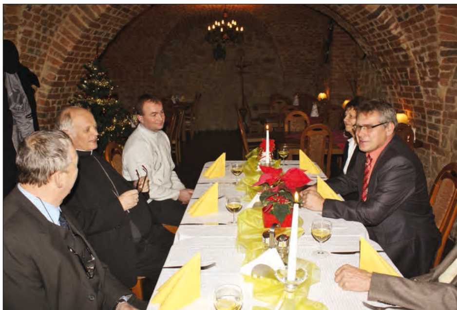
V zámecké restauraci